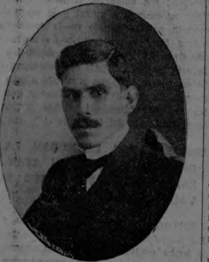
DON LUIS FELIPE GONZALEZ, Subsecretario de Instrucción Pública

Y de sobra hay razón para ello. Una Escuela Normal sólo debe atender a la preparación y producción de maestros de verdadero preceptores.